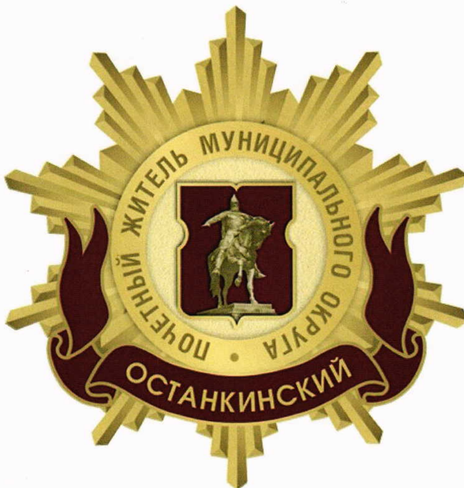
Рисунок нагрудного знака к званию «Почетный житель внутригородского муниципального образования – муниципального округа Останкинский в городе Москве»

Приложение 3 к решению Совета депутатов внутригородского муниципального образования – муниципального округа Останкинский в городе Москве от 19.02.2025 № 3/6