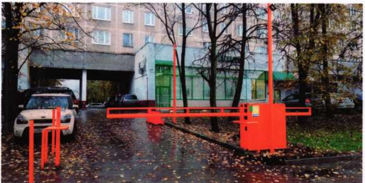
Рис. 2 Внешний вид шлагбаума и ответного столба

Дорожный откатной шлагбаум с автоматическим электромеханическим приводом отката стрелы. Шлагбаум состоит из металлической стрелы и стальной стойки, установленной на бетонное основание и закрепленной болтами, вмонтированными в бетонное основание. В стойке шлагбаума находится электромеханический привод, а также блок электронного управления. Привод, перемещающий стрелу, состоит из электродвигателя, скоростного мотора-редуктора. Шлагбаум снабжен регулируемым устройством безопасности, а также устройством фиксации стрелы в любом положении и ручным расцепителем для работы в случае отсутствия электроэнергии.