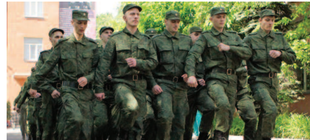
Весенний призыв – 2022: есть ли особенности? стр. 6