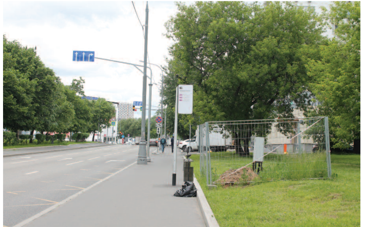
Остановка общественного транспорта на Звездном бульваре, 44

– По очень разным. Большинство обращений, конечно, связано с работой коммунальных служб, в частности, районного ГБУ «Жилищник», с