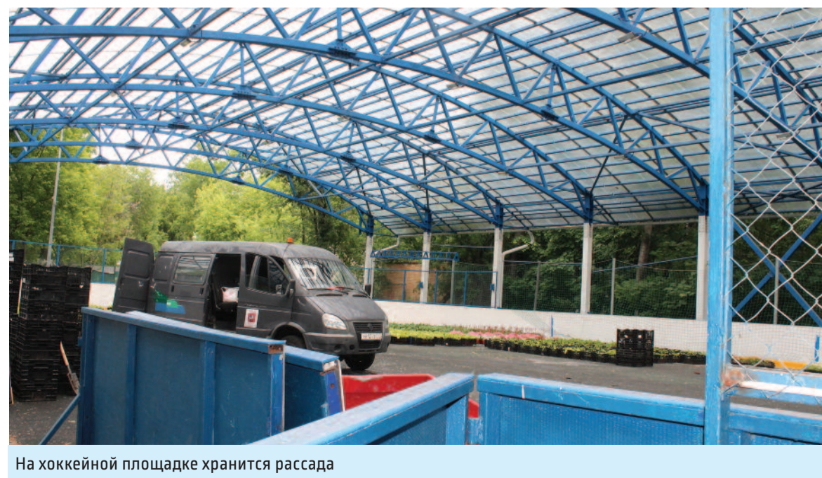
На хоккейной площадке хранится рассада

района с искусственным покрытием. Здесь есть целый ряд недостатков, которые не только мешают нормально играть (часто портятся мячи), но и могут быть очень опасны, – продолжает Сергей Леонидович.