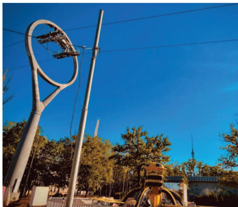
Тросы канатной дороги идут прямо над детской площадкой