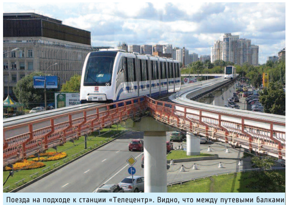
Поезда на подходе к станции «Телецентр». Видно, что между путевыми балками устроены служебные пешеходные дорожки.