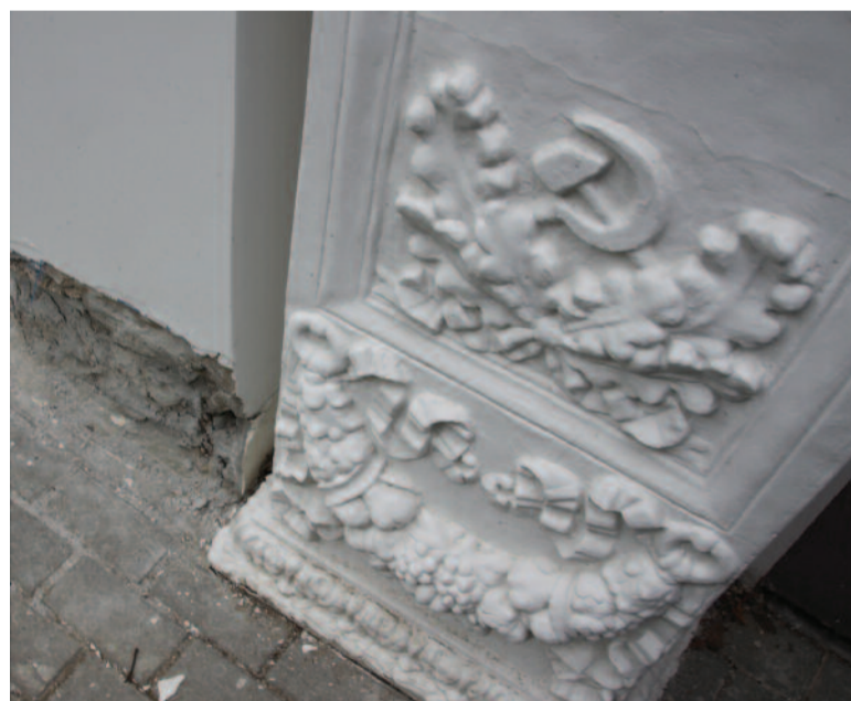
С таким качеством провели реставрацию павильонов

за несколько лет. Вот решение Арбитражного суда г. Москвы от 21 февраля 2019 года. Межрегиональное технологическое управление Ростехнадзора обратилось в суд с заявлением о привлечении к административной ответственности ООО «Пицца-ротти И.Е.», ведущего строительство тематического парка аттракционов «Парк будущего». Дело в том, что ООО