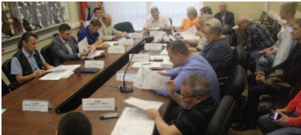
Что обсуждали на заседании Совета депутатов? стр. 2