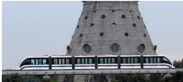
Монорельс должен жить! стр. 2