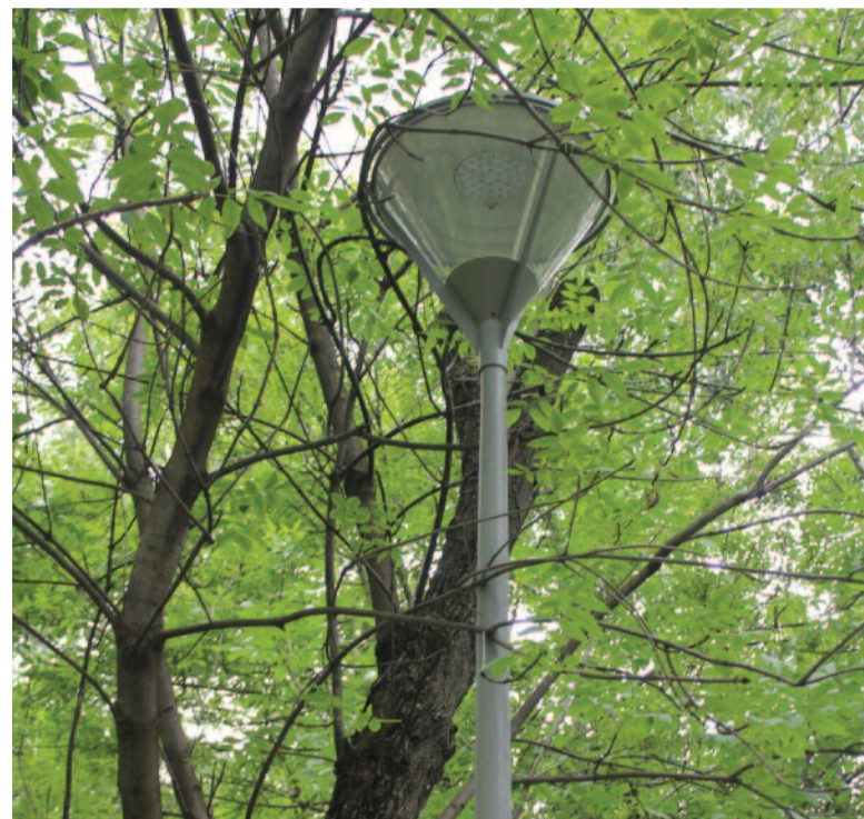
Фонарь на Звездном бульваре