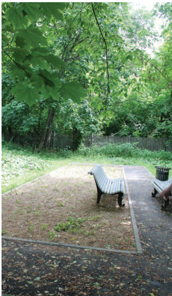
Площадка для петанка на Прудовом проезде

обеспечить жителей района спорт-площадками – футбольными, волей-большими, тренажерными. А следующей задачей будет организация спортивной работы (кружки, секции, соревнования). Проекты благоустройства дворовых территорий, в том числе спортивных объектов, формируются управой на основании предложений жителей. С проектами знакомят и депутаты. Но у нас действуют законы и бюрократи-