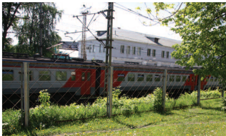
Вдоль железной дороги на Мурманском проезде обещают установить шумозащитные экраны