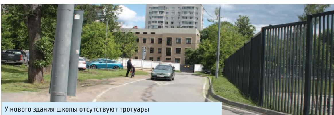
У нового здания школы отсутствуют тротуары