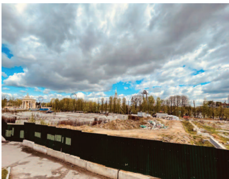
Стройплощадка будущего парка аттракционов