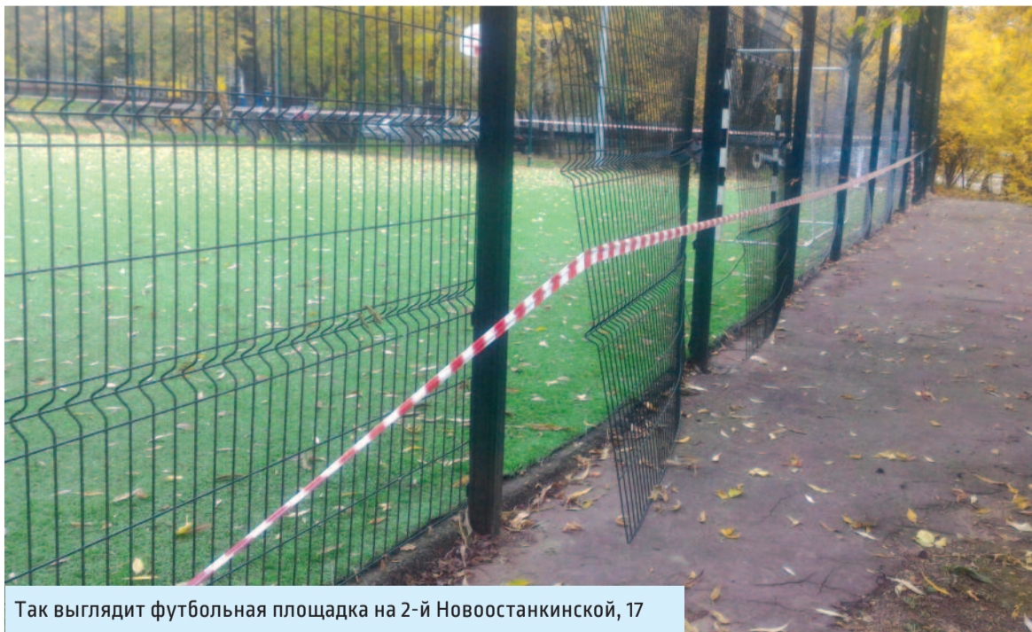
Так выглядит футбольная площадка на 2-й Новоостанкинской, 17