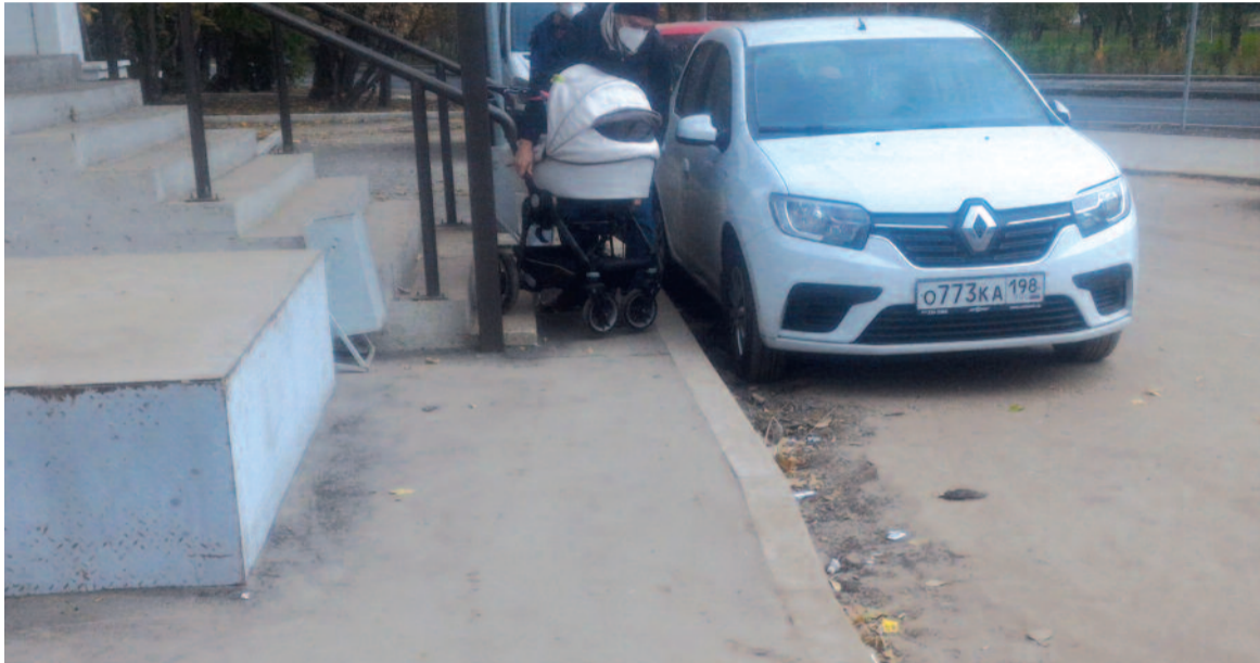
Площадка перед магазином «Магнит» [Звездный бульвар, 40]

– Во дворе по 2-й Новоостанкинской, 17, находится футбольная площадка с искусственным покрытием. Есть освещение, но ограждение пришло в негодность, так как изначально было выбрано неправильно. К сожалению, спортивные объекты со временем изнашиваются, поэтому сетки на воротах уже почти нет, забор площадки обзавелся дырами и торчащими прутьями, кое-как залатан проволокой и сеткой рабица. А ведь это единственная дворовая площадка