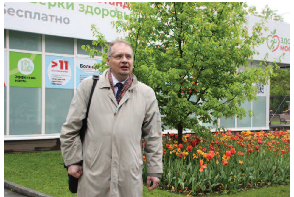
Глава муниципального округа Останкинский Константин Рахилин