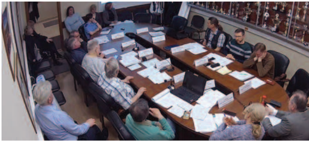
Что обсуждали на заседании Совета депутатов? стр. 2