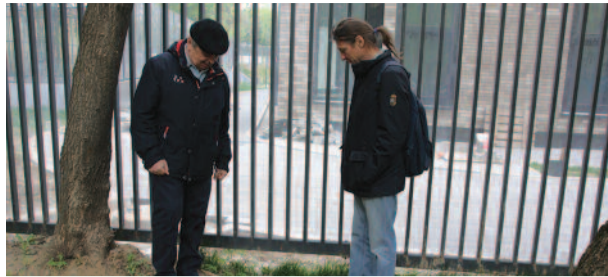
На прогулке с депутатом стр. 4-5