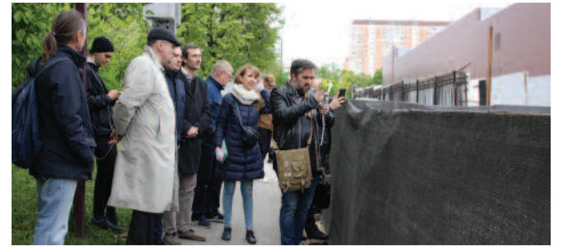
Провал грунта: депутаты бьют тревогу стр. 6