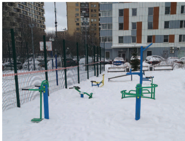
Весь двор занесен снегом...

Вот так, дорогие жители, вам отвечают – на сей раз корректно: двор – ваша частная собственность, вы ею и занимаетесь. Силами вашей ответственности или еще как – нас не волнует. И неважно, что содержание территории не входит в обязанности общественного формирования, коим является совет многоквартирного дома, а отдавать подобные распоряжения председателю совета дома не входит в полномочия управы. Всеми этими пустяками можно пренебречь. А об исполнении доложить.