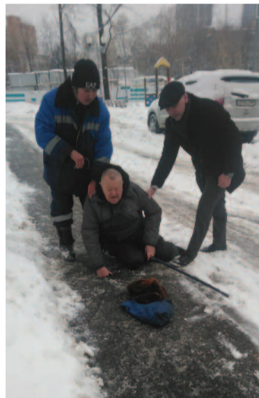
Дорожки у дома чистят так, что гололед на них остается

Нет, как и абсолютное большинство жилых строений в Останкинском районе, «наш» дом находится под управлением родного районного «Жилищника». Но его работники слегка расчищают лишь дорожки вдоль дома, а во двор не заглядывают. Вот и не убирается спортивная площадка, погребены под сугробами детская площадка, уличные