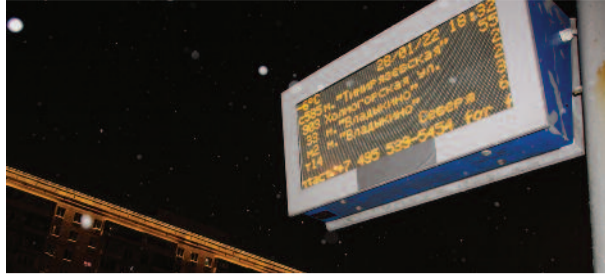
Продолжаем разговор об изменениях в работе общественного транспорта стр. 4-5