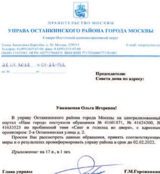
Эти письма поступили председателям советов домов

нием, жители пошли в суд. Но рассмотрение их иска о признании установления сервитута незаконным затягивается по формальным причинам аж с 11 октября.