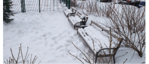
Обязанность убирать территорию у дома возложили на общественность стр. 6-7