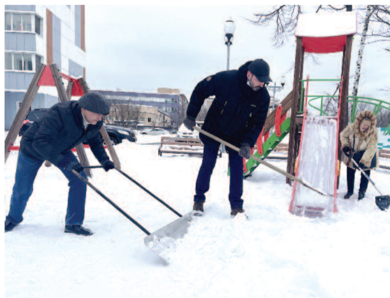
На уборку выходят члены совета дома

При этом участок, на котором располагается дом, был обозначен как «находящийся в государственной собственности». А не в частной, как значится в Публичной кадастровой карте. Это и понятно – ведь частную территорию волевым решением отторгнуть нельзя, закон гласит, что «уменьшение размера общего имущества в многоквартирном доме возможно только с согласия всех собственников помещений в данном доме путем его реконструкции». А обращаться за таким согласием к жителям дома 11, понятно, никто не собирался. Просто отняли часть тер-