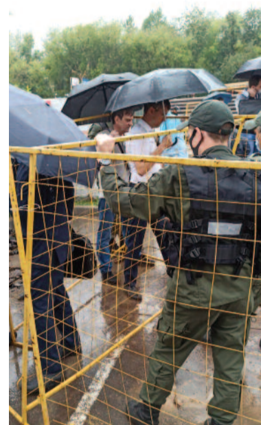
Противостояние с застройщиками летом прошлого года

Своим распоряжением Департамент городского имущества, если говорить по-простому, отрезал у