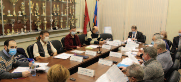
Какие решения приняли на заседании Совета депутатов? стр. 2