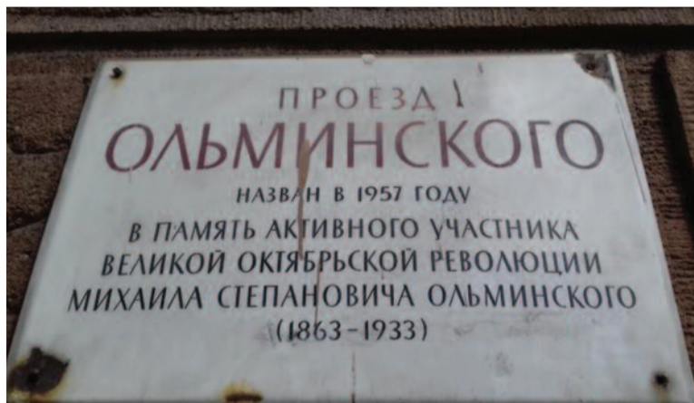
Информационная табличка на здании Московской типографии Гознака

Об истории наименования улиц рассказывали специальные информационные единообразные белые металлические таблички, которые в советский период размещались на первых домах улиц. Со временем, ввиду того, что собственникам зданий, управляющим организациям, району и городу не были дороги эти таблички, как и история города, они стали вороваться «черными» сборщиками металлолома. Были таблички и информирующие, в честь кого на-