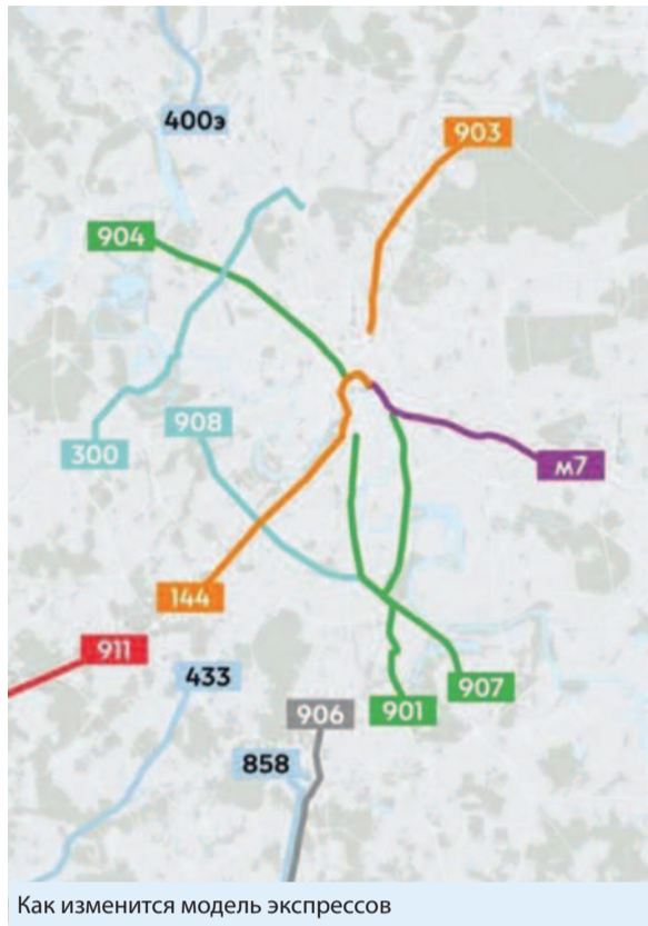
Как изменится модель экспрессов

Если бы проект разрабатывался совместно с жителями, было бы сложнее из-за споров и вопросов. Но горожане восприняли бы эту реформу намного проще. Не было бы такого количества негатива, какое мы видим в районных группах. Хотя бы депутатов надо было поставить в из-