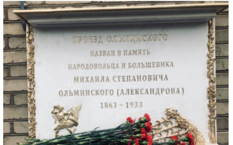
Новодел с ангелом – новая информационная табличка на доме 3 по проезду Ольминского

Некоторые СМИ сообщили, что весной этого года «отреставрировали» мемориальную доску в честь Михаила Ольминского. Доска много лет была размещена на стене единственного на проезде жилого дома № 3 и якобы утратила «приличный» вид – буквы были затерты, камень (а на самом деле металл) потемнел, и от времени получился «исторический» вид. К счастью, остались фотографии, и такая же доска висит на охраняемом объекте – торце здания Москов-