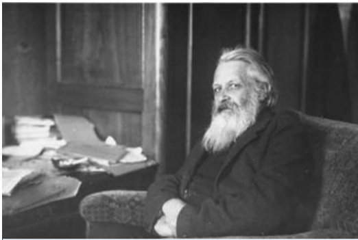
Михаил Ольминский, один из тех, с кого начиналась газета «Правда»

Память о Революции и революционерах в истории и топонимике нашего района