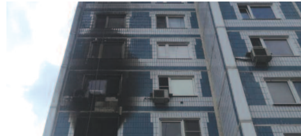
Помогли пострадавшим при пожаре стр.8