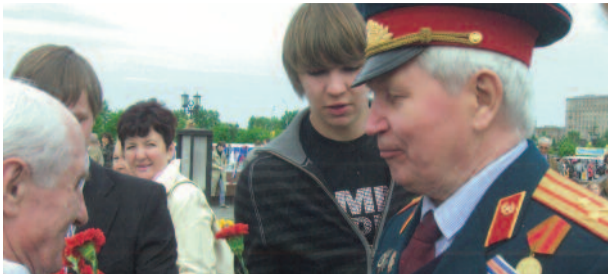
Участники Великой Отечественной войны: поколение победителей стр. 4-5, 7