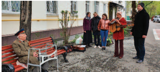
Концерт для ветерана стр. 8