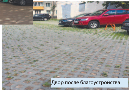
Двор после благоустройства

проход из арки закрепил за новым домом без какого-либо обременения для прохода жителей. Отвечая на вопрос, где же людям ходить, Департамент предложил жителям проход на территорию квартала между домами 83 и 85, как и было ранее. Жители дома 83 тут же поставили вокруг своего дома высоченный забор, а управа Останкинского района совместно с «Жилищником» заасфальтировали протоптанную по дворовой территории дома 81 дорожку. И вид теперь никакой, и дорожка из арки кривая получилась: выйдя из нее, прямо не пойдешь, нужно огибать забор, перешагивая между люками колодцев. В настоящее время идет судебное разбирательство о законности возведения дорожки по нашей территории.