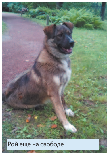
Рой еще на свободе

5 ноября моя собака Рой была обнаружена в приюте «Дубовая роща». В приют было подано заявление от А. Салаховой – моего действующего представителя (имеющего на руках доверенность от меня на действия от