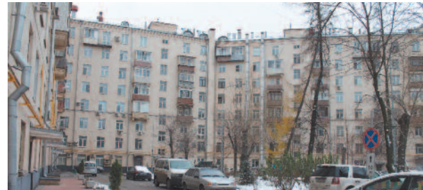
Что может совет дома стр. 6-7