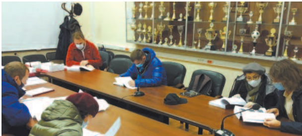
Получен проект планировки территории микрорайонов 14, 15-16 и квартала 104 стр. 3