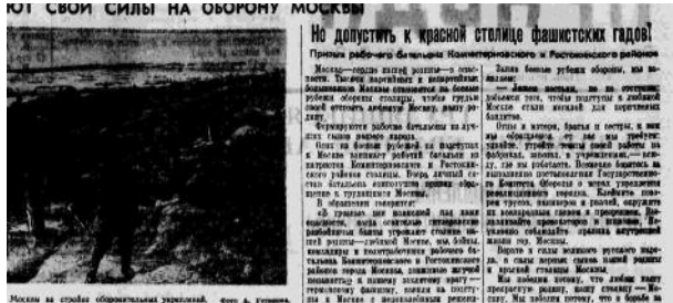
Из истории Московского ополчения стр. 5