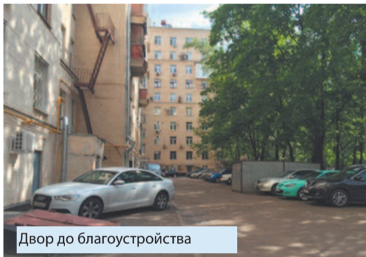
Двор до благоустройства

Благодаря сплоченности совета МКД и поддержке муниципальных депутатов, а в последнее время и пониманию со стороны управы, у нас уже и сейчас очень красивая и удобная детская площадка, экопарковка, высажены деревья и кустарники, уложена качественная тротуарная плитка вместо асфальта, частично освещен двор. Уверен, если бы мы все больше интересовались тем, что происходит за пределами своей квартиры, то с теми ресурсами, которые есть у Москвы, с поддержкой инициатив жителей со стороны депутатов и исполнительной власти жизнь москвичей могла бы быть совсем другой. Пока мы сами не возьмем инициативу в свои руки, к нашим домам будут относиться как к колхозной