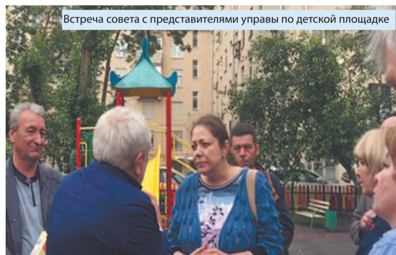
Встреча совета с представителями управы по детской площадке