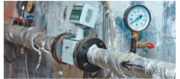
ЖКХ-монстр по имени «Жилищник» стр. 6