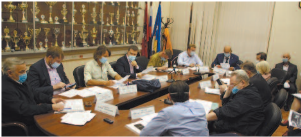
Что обсуждали на заседании Совета депутатов стр. 2