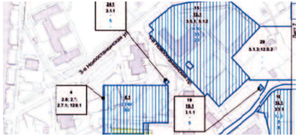
Точечная застройка превратится в очередную горячую точку? стр. 5