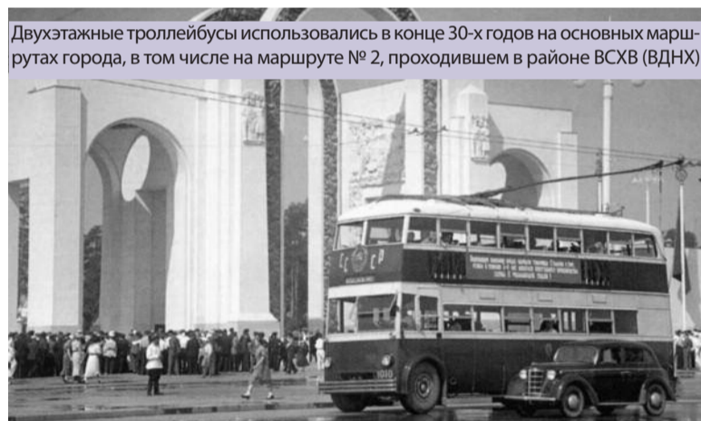
Двухэтажные троллейбусы использовались в конце 30-х годов на основных маршрутах города, в том числе на маршруте № 2, проходившем в районе ВСХВ (ВДНХ)