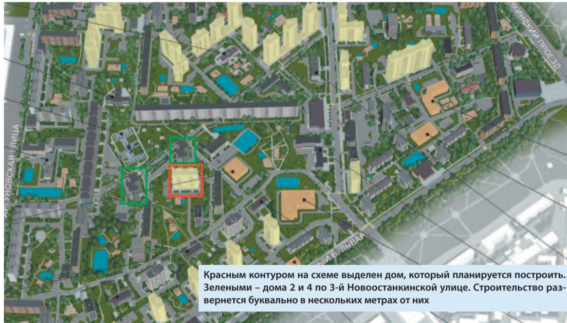
Красным контуром на схеме выделен дом, который планируется построить. Зелеными – дома 2 и 4 по 3-й Новоостанкинской улице. Строительство развернется буквально в нескольких метрах от них

зимой целую кампанию по выбору новых каруселей и горок, собирали у жителей пожелания, устраивали совещания с инициативной группой, просто забыв сказать, что через полгода-год