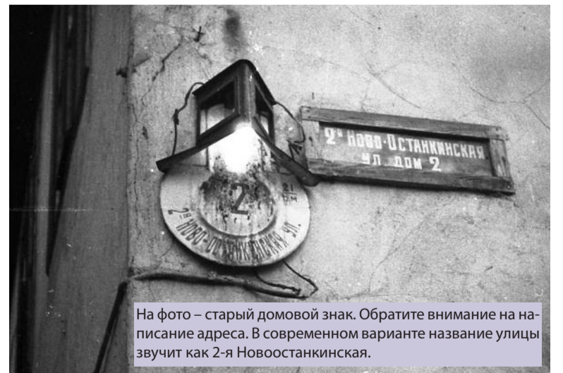
На фото – старый домовый знак. Обратите внимание на написание адреса. В современном варианте название улицы звучит как 2-я Новоостанкинская.

фии обязательно будут публиковаться в газете.