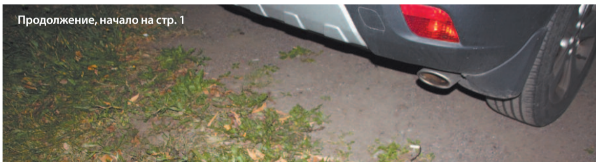
Продолжение, начало на стр. 1