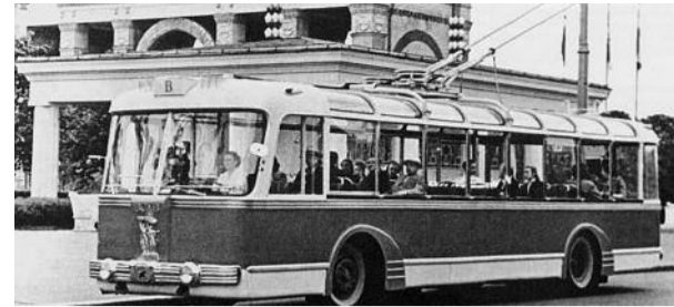
Последний троллейбус... стр. 8