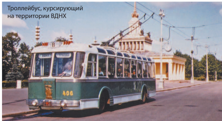
Троллейбус, курсирующий на территории ВДНХ

Продолжение в следующем номере