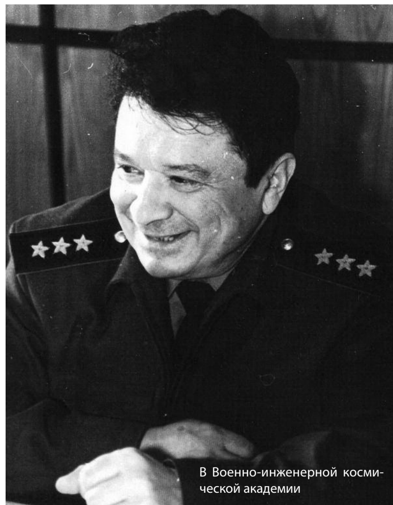
В Военно-инженерной космической академии