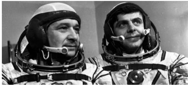
Леонид Кизим: 374 суток в космосе стр. 6-7