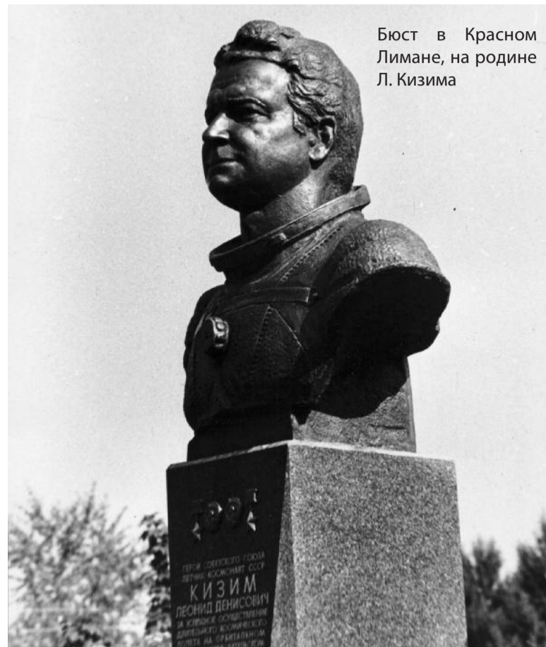
Бюст в Красном Лимане, на родине Л. Кизима

– С женьбой связана целая история... Отец жил в Звездном городке, работал в Центре подготовки космонавтов, а ему к тому времени было уже за тридцать, быть холостым в таком возрасте тогда было почти неприлично, и, кажется, руководство такое тоже не одобряло. Большинство друзей давно женаты. Они-то и «под-