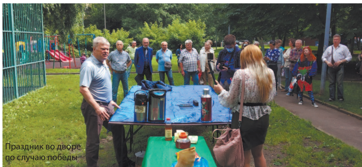
Праздник во дворе по случаю победы