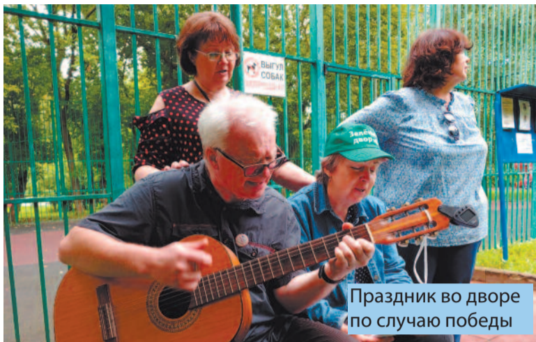
Праздник во дворе по случаю победы

15 февраля дом, против строительства которого еще задолго до принятия программы реновации возражали местные жители, справедливо полагая, что это будет обыкновенная точечная застройка, перевели в статус стартового, т.е. реновационного. И с тех пор интересы проживающих в данном микрорайоне разделились. Бесплатно получить новую квартиру большей площади рядом со своим старым домом... многие из читающих эти строки с радостью бы согласились. Но русская пословица гласит: «На чужом несчастье свое счастье не построишь!»