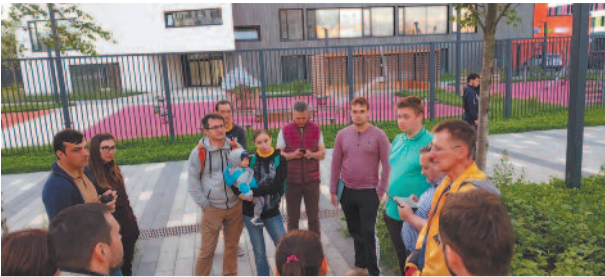
Обсудили проблемы «дальней» территории района стр. 3