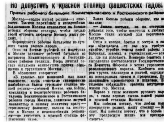
Газета «Правда» от 20 октября 1941 года

Из них: 110 человек были награждены орденами и медалями; 23 женщины, в т.ч. 20 медиков; 104 погибли или пропали без вести. Мы установили или уточнили 72 места захоронения. Более 80% погибших или пропавших без вести – это бойцы и командиры, жизнь которых была прервана в феврале – апреле 1942 года в тяжелых боях Демьянской наступательной операции. Удалось установить 74 довоенных места жительства. Найдены 52