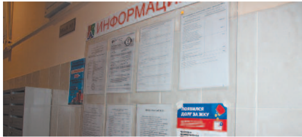
Информационные стенды в подъездах: решение за жителями стр. 6