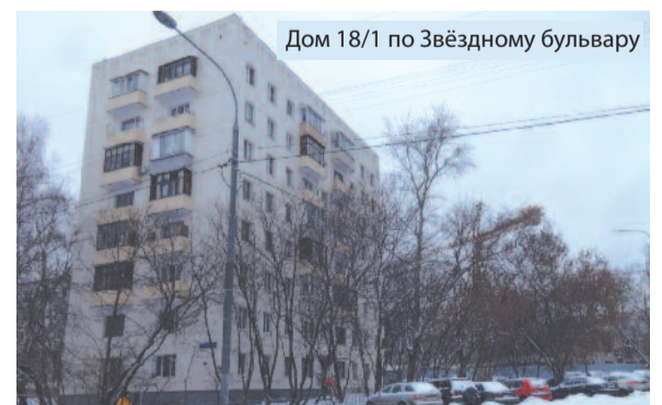
Дом 18/1 по Звёздному бульвару

Павел КИРИКОВ, депутат муниципального округа Останкинский