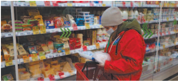
На помощь приходят волонтеры стр. 4