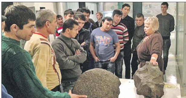
Для мигрантов организовали экскурсию в Музей космонавтики