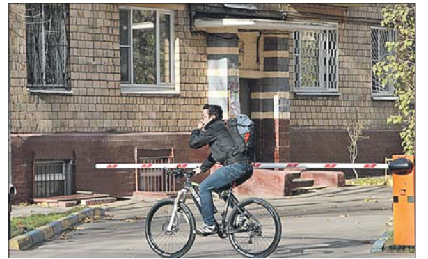
Шлагбаумы появятся по инициативе жителей

Муниципальные депутаты согласовали установку шлагбаумов в нескольких дворах Останкинского района. Ограждающие устройства появятся по адресам: Звёздный бул., 25; ул. Бочкова, 3 и 6, корп. 1 и 2; ул. Академика Королёва, 11. Жители этих домов обратились с подобной инициативой к депутатам после введения в районе