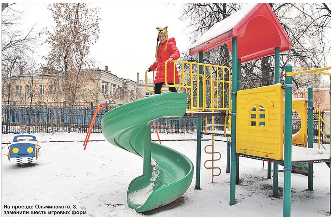
На проезде Ольминского, 3, заменили шесть игровых форм

Подведены итоги благоустройства во дворах района