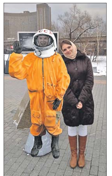
Для такого кадра понадобится мобильное приложение «Узнай Москву. Фото»

Для того чтобы сделать фотографию со знаменитостью, нужно скачать и запустить мобильное приложение «Узнай Москву. Фото» для платформ iOS и Android, навести камеру смартфона на имя персонажа на табличке так, чтобы на экране появилась 3D-фигура. Затем необходимо выбрать