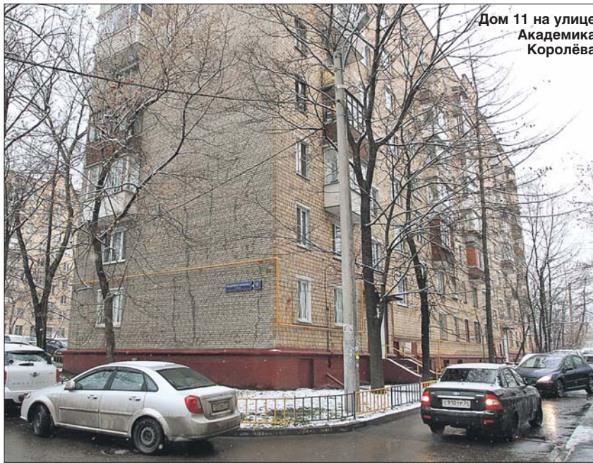
Дом 11 на улице Академика Королёва

На 2-й Останкинской, 4, запланирована реконструкция входа в подъезд