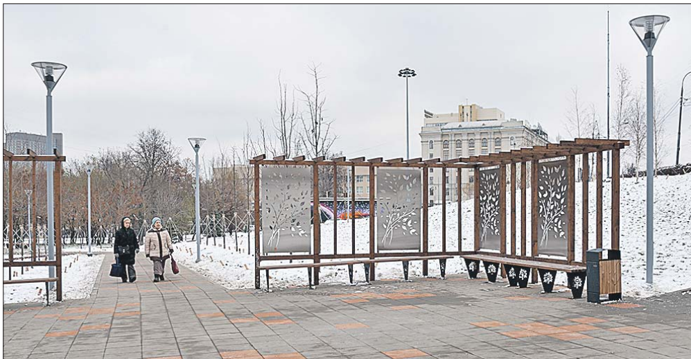
На Звёздном бульваре оборудуют поручни для прохожих и тактильные полосы для слабовидящих

— Решать эту проблему можно и нужно. Она существует не только в вашем дворе, есть ещё ряд адресов. Прошу районных депутатов и управу составить перечень тёмных дворов — в следующем году в рамках комплексного благоустройства дворов мы постараемся найти средства на их освещение. Это очень важный вопрос, так как он напрямую касается безопасности.