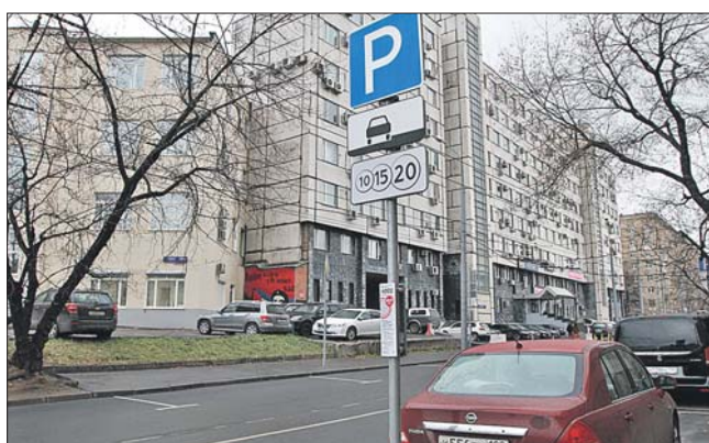
Платная парковка в Останкинском районе

— Платная парковка была введена в тех точках, где отмечалось многократное превышение ёмкости парковочного пространства, большое количество ДТП с затруднениями в движении общественного транспорта. Парковочные места ста-