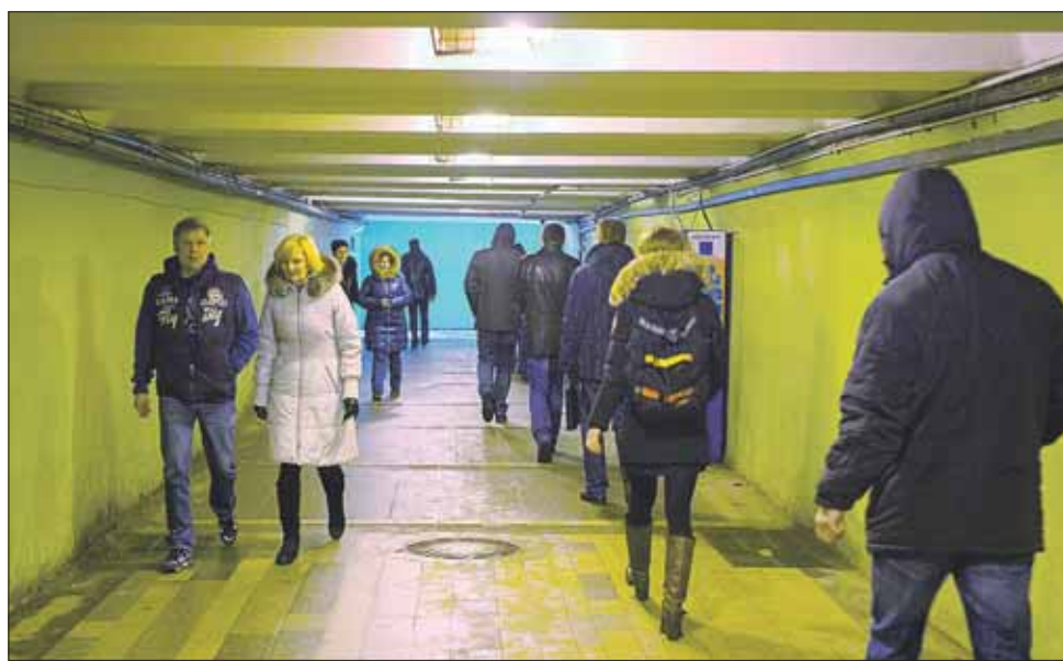
Депутаты обсудили обстановку в переходе у метро «Алексеевская»

Кроме того, начальник районного ОМВД пояснил депутатам, какие вопросы не входят в компетенцию полиции.