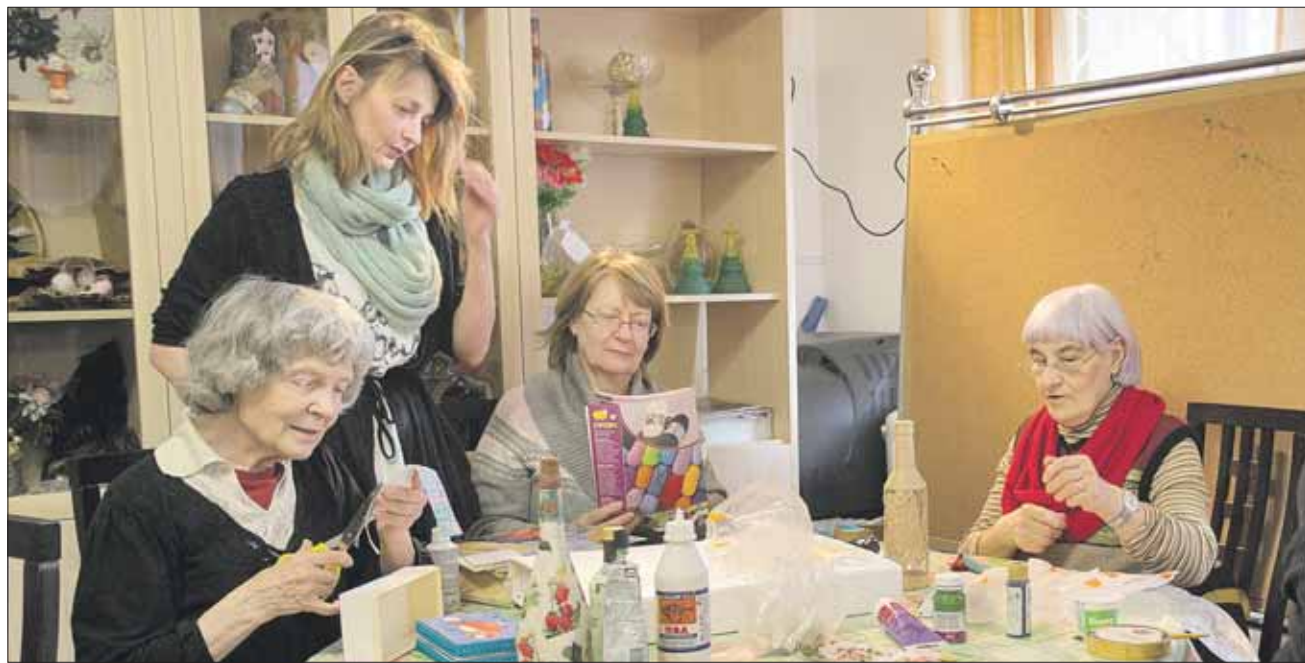
Занятие кружка «Дамские штучки» в филиале Центра соцобслуживания на 2-й Новоостанкинской

Кроме того, филиал занимается оказанием платных социальных услуг. За год оказано 2010 услуг на сумму 607 724 рубля. Наиболее во-