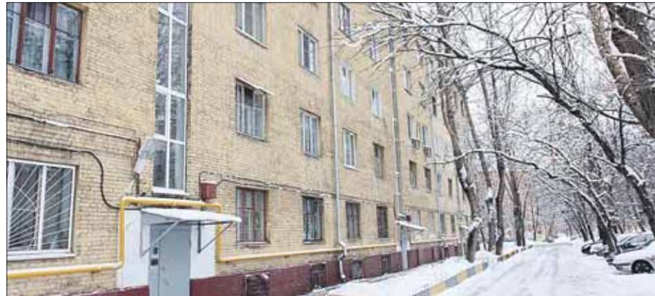
В доме 5, корпус 1, на улице Годовикова под контролем депутатов в прошлом году заменили окна на лестничных площадках

В связи с выделением Советом депутатов на 2015 год значительных денежных средств на оказание материальной помощи жителям