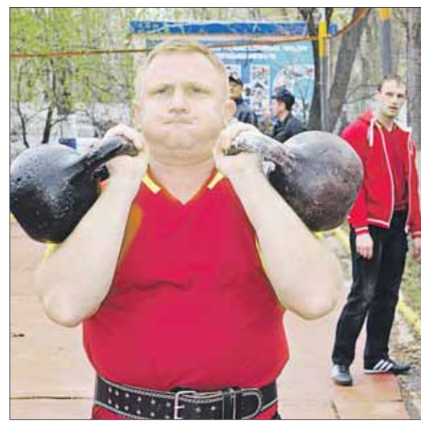
В программе Дня физкультурника — гиревой спорт и многое другое