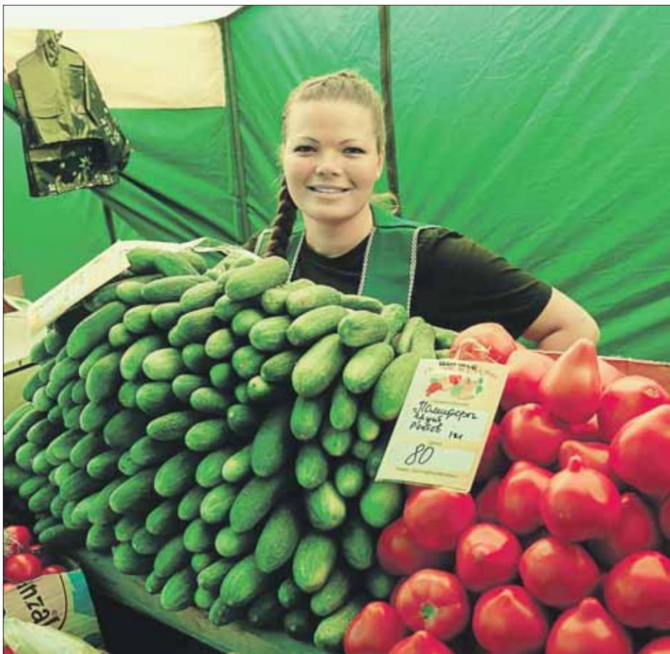
На новом месте ярмарки будет торговать не только овощами, но и мясо-молочной продукцией

На 1-й Останкинской сельхозпроизводителям приходится конкурировать с «красным», как его назы-