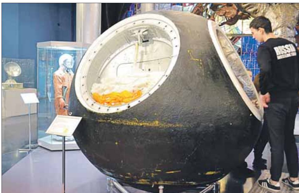
Спускаемый аппарат серии «Восток» в Музее космонавтики

Результаты публичных слушаний по проекту решения Совета депутатов муниципального округа Останкинский